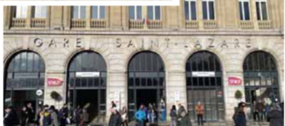
サンラザール駅正面広場内 →