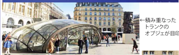
←積み重なった トランクの オブジェが目印