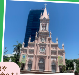
龍橋や ダナン教会へも!