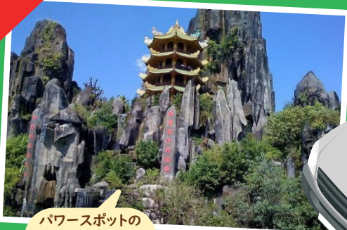
パワースポットの マーブルマウンテン (五行山)も停車 スポットです!