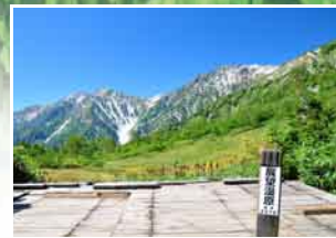
間近にせまる白馬大雪渓と 北アルプスの眺望 『展望湿原』