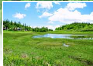
静寂に包まれた池に小さな浮島と 高山植物のお花畑 『浮島湿原』