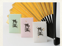
※御守神塩イメージ