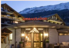
アンバサダーホテル