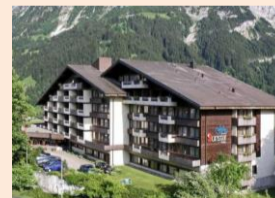
ホテルサンスター