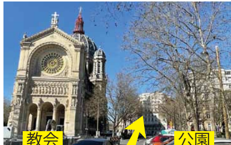
教会 ↑ 公園 ↑ 教会と公園の間の道を進みます ↑