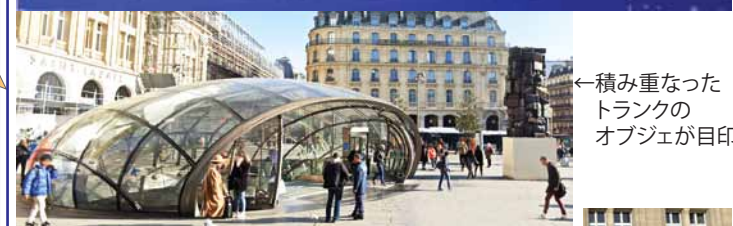
←積み重なった トランクの オブジェが目印