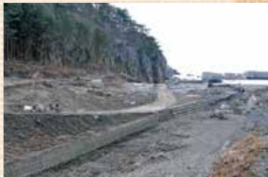
3.11で流失した番屋跡地