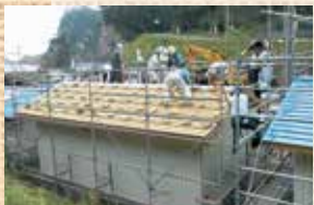
ボランティア石柱屋根づくり

机浜番屋群は北山崎の断崖の間にある小さな入江にあります。車のない時代、普段は浜辺から5km程離れた高台で農業等を営み、盛漁期には番屋に寝泊まりをしながらワカメ・コンブ・ウニ・アワビや季節の魚を捕り、半農半漁の暮らしをしていました。24棟の木造番屋は昭和三陸大津波(昭和8年3月3日)後に、漁師たちが自らの手で建て直したもので、自然の木や浜辺の石を使っていました。時代とともに修繕にトタンが使われるようになり、潮風で錆びたトタンが昔から続く漁村文化を今に伝えてくれています。平成18年には「未来に残したい漁業漁村の歴史文化財産百選」に選ばれ、昔ながらの風景を楽しむに訪れる観光客と地域住民の交流拠点として賑わっていました。